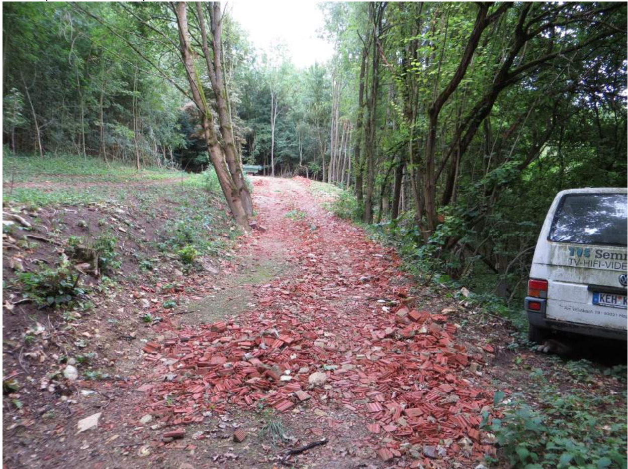
Bild 3, keine Abholzungen, kein Weg